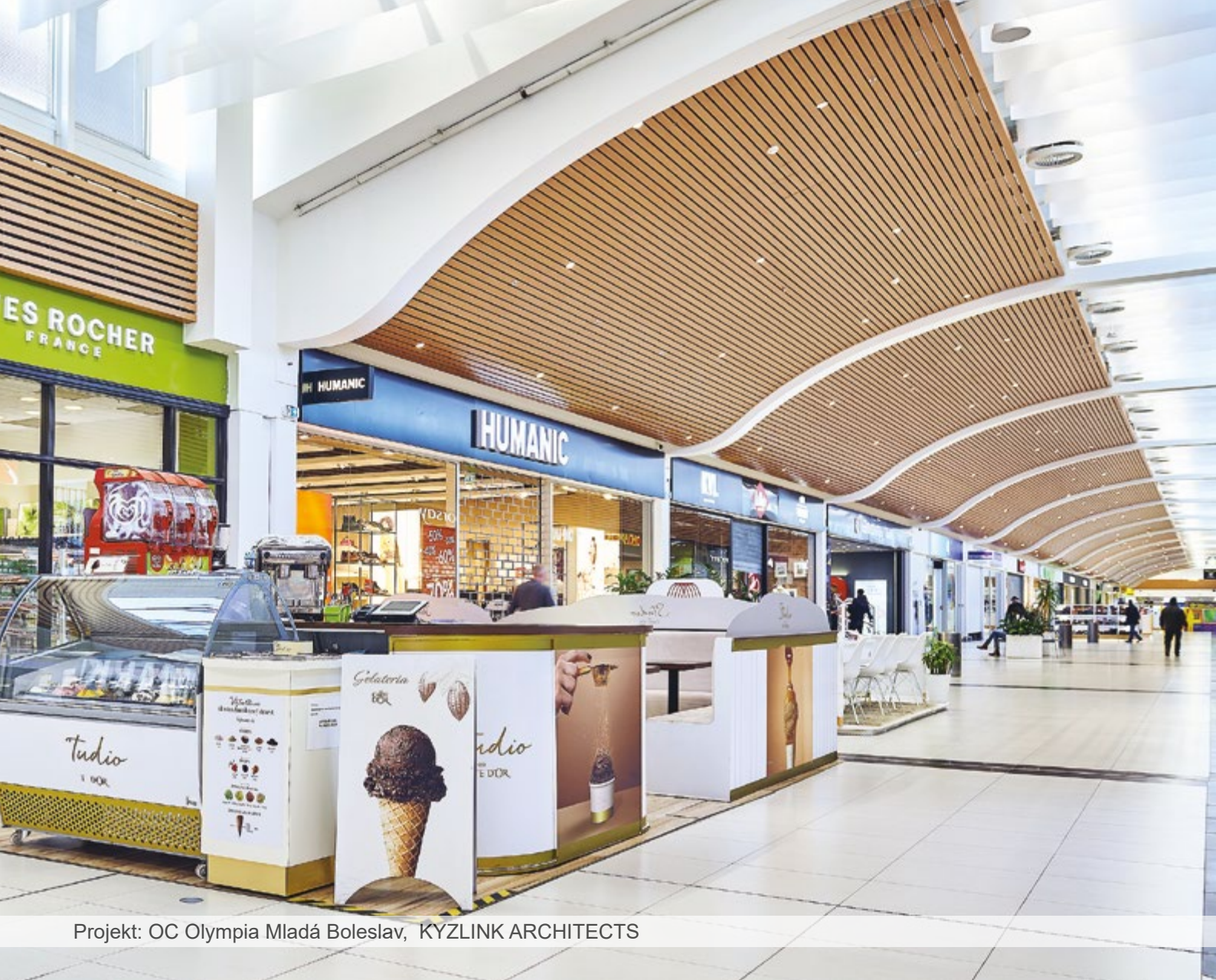
Projekt: OC Olympia Mladá Boleslav, KYZLINK ARCHITECTS