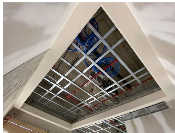
Velkoformátové plechové obklady stávajících konstrukcí, rozvody TZB a požárních rolet.